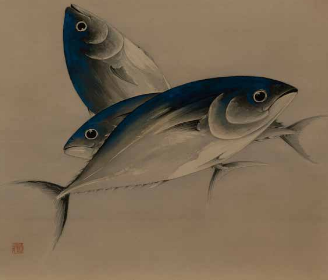
尾竹竹坡《鯉》個人蔵 ※前期展示