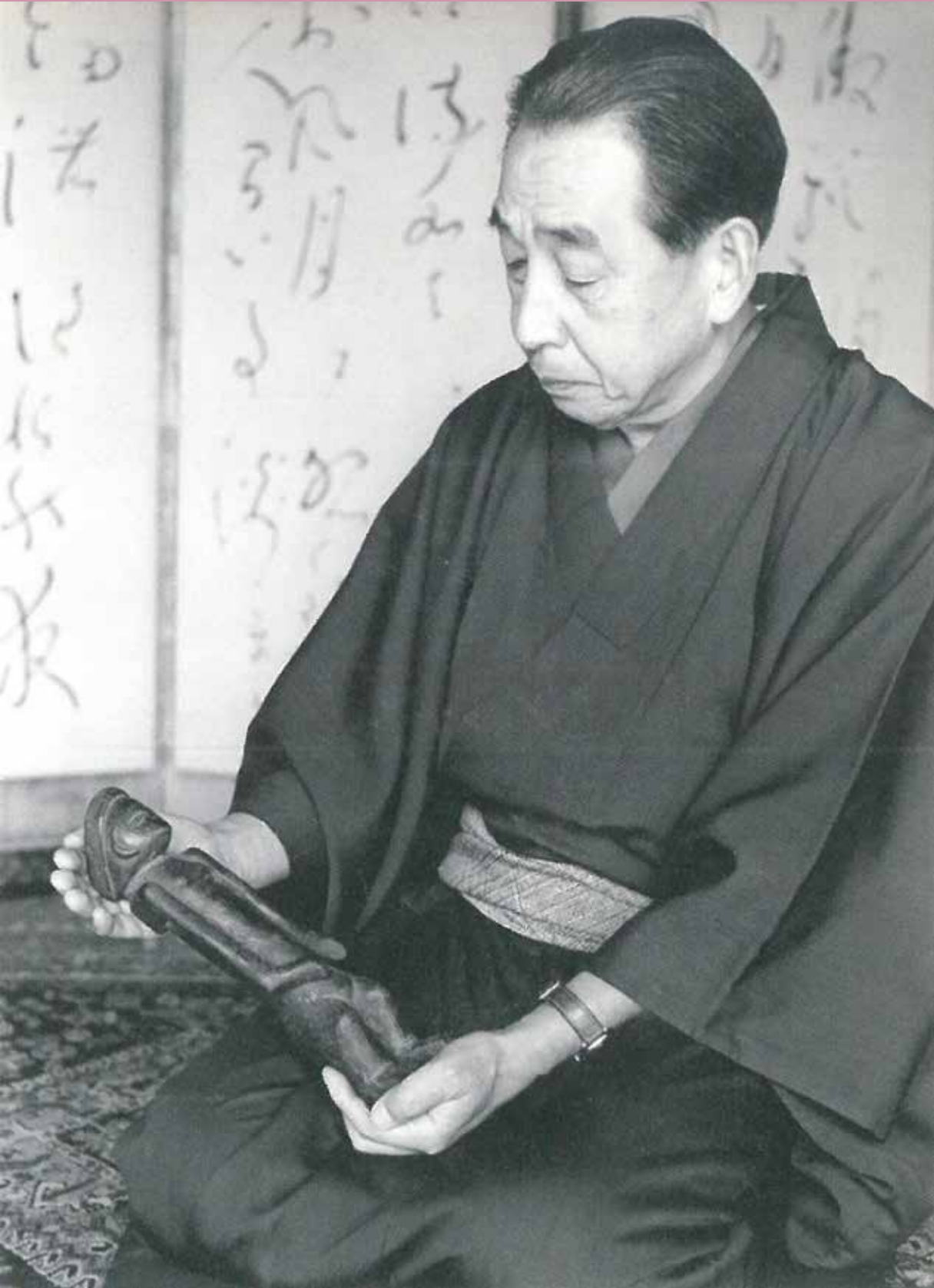
良寛の屏風の前で