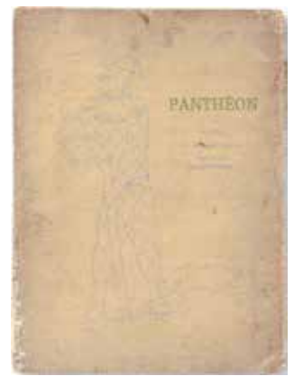
堀口大學・日夏耿之介・西条八十編集 雑誌「パンテオン」第1号 1928(昭和3)年 第一書房発行 個人蔵