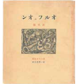
堀口大學編集 雑誌「オルフェオン」創刊号 1929(昭和4)年 第一書房発行 個人蔵